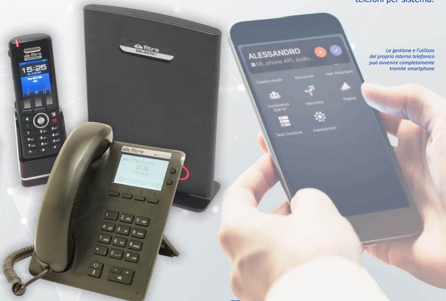
La gestione e l'utilizzo del proprio interno telefonico può avvenire completamente tramite smartphone

Tutti i sistemi ML System sono integrabili con i sistemi DECT IP multicella SEL3010 , in grado di coprire vaste aree grazie alla capacità che arriva fino a 254 basi e 1000 telefoni per sistema.