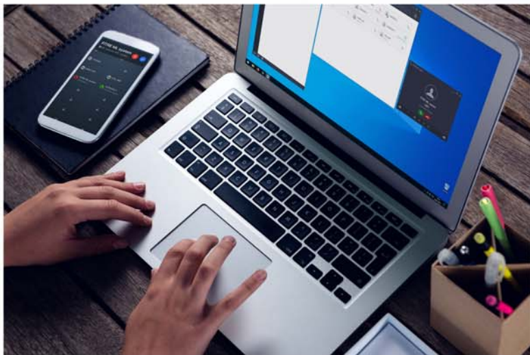
Softphone porta il proprio interno e tutte le funzioni della centrale su smartphone e PC