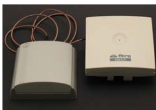
DECT115 (Cod. 7128773) Ripetitore DECT con antenna direttiva

I ripetitori (fino a 6) sono collegati via radio alla stazione base e la loro funzione è quella di estendere il campo di copertura. È possibile collegare fino a 3 ripetitori connessi a catena tra loro.