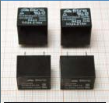
RELÈ GENERAL PURPOSE