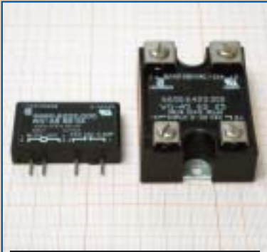
RELÈ STATO SOLIDO