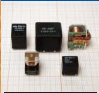
RELÈ AUTOMOTIVE PCB