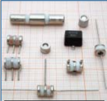
SCARICATORI DI TENSIONE