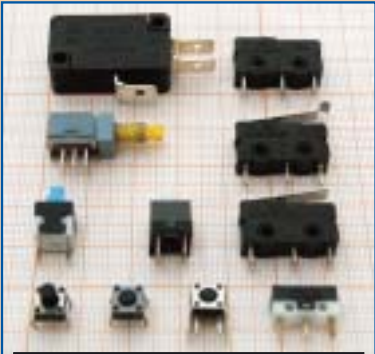
MICRO TACT SWITCHES