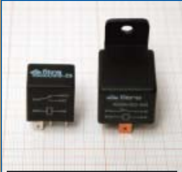
RELÈ AUTOMOTIVE FASTON