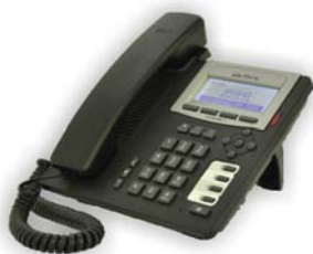
TF615IP Telefono standard SIP