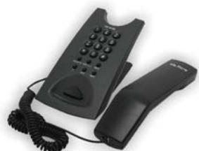
TF410 Telefono analogico