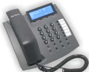
TF425+ green Telefono analogico con display